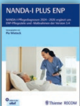
NANDA-I PLUS ENP